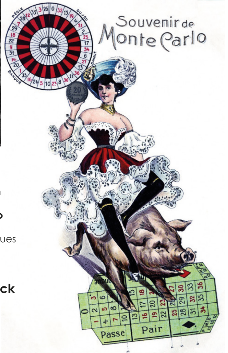
Carte postale satirique

Avec le soutien de la Compagnie Florestan