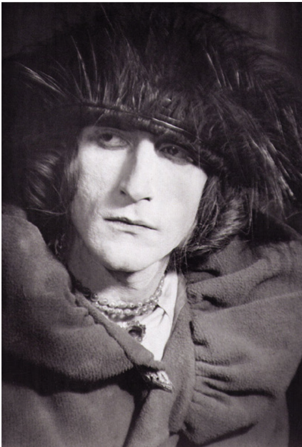
Rose Sélavy, 1920

Lettre newyorkaise de Marcel Duchamp à sa sœur Suzanne et à son beau-frère Jean Crotti du 17 août 1952.