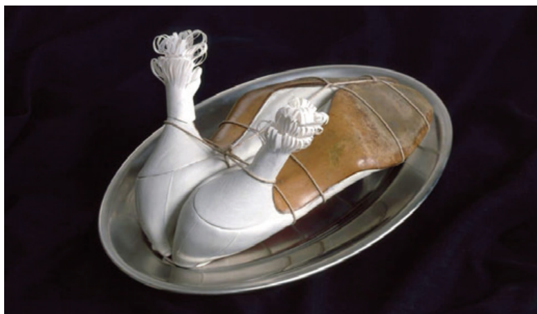
« Ma gouvernante », Meret Oppenheim, 1936