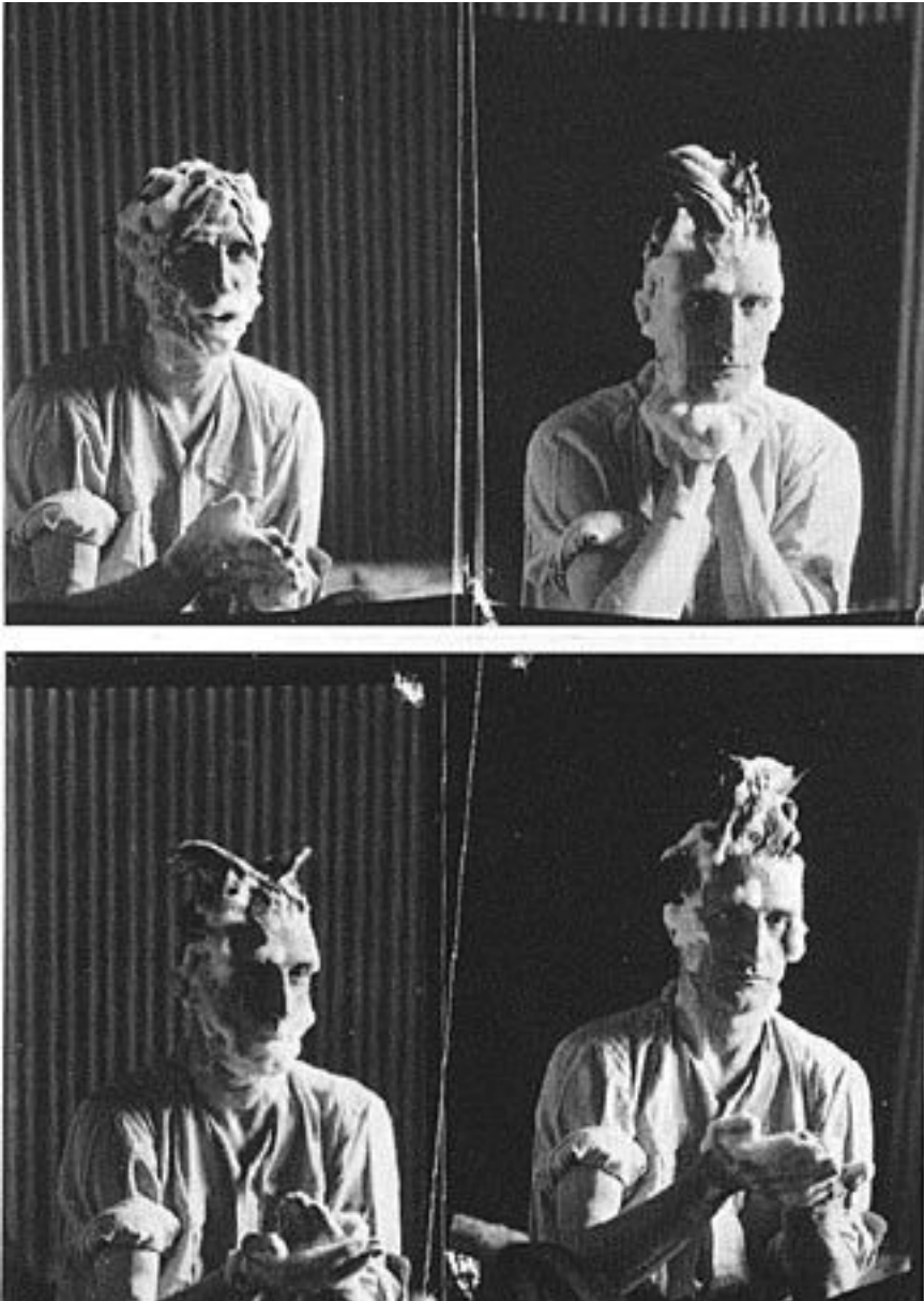
Marcel Duchamp with soap bubbles, Photographie de Man Ray, 1924