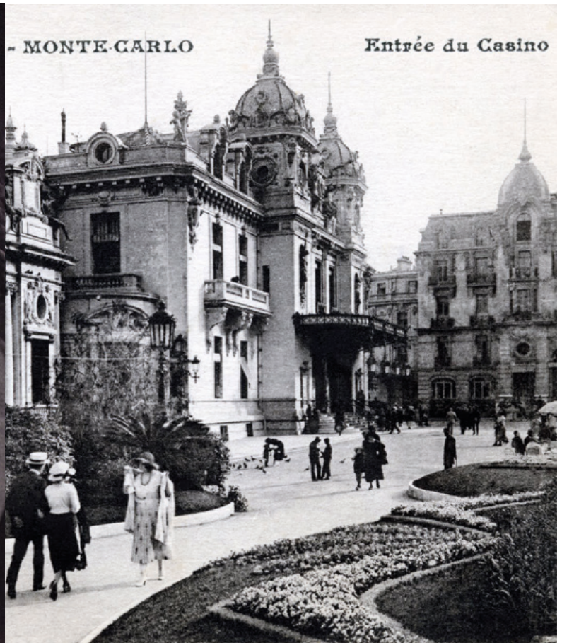
Carte postale Casino de Monte-Carlo

Le Centenaire des Monte Carlo Bonds ou Obligations de Monte Carlo de Marcel Duchamp édités le 1er novembre 1924 puis en 1925 est l'occasion de célébrer et honorer cet invité de marque, figure marquante de l'histoire de l'art du XXe siècle ?